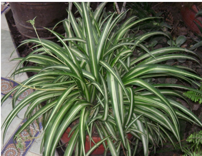
Chlorophytum comosum ( C. elatum ) 'Vittatum'