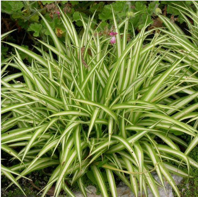
Chlorophytum comosum ( C. elatum ) 'Variegatum'

(Categoria delle erbacee perenni rustiche)