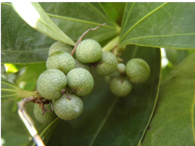
Frutti a drupa del Cocculus laurifolius

(particolare delle foglie con 3 nervature principali)