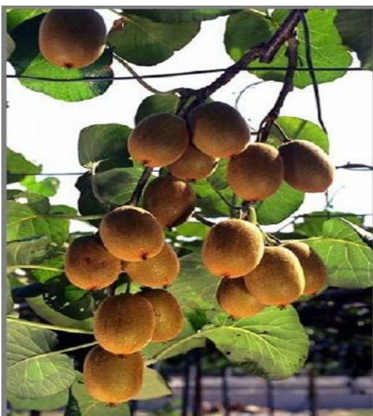
Particolare dei frutti

Pianta rampicante molto ornamentale, vigorosa e rustica, con ramificazioni allungate e serpeggianti, a foglie caduche e frutti commestibili; dioica. Le Actinidia sono adatte per la coltivazione lungo i muri, ovviamente con l'aggiunta di sostegni, per pergole e per rivestimento dei fusti di vecchi alberi.