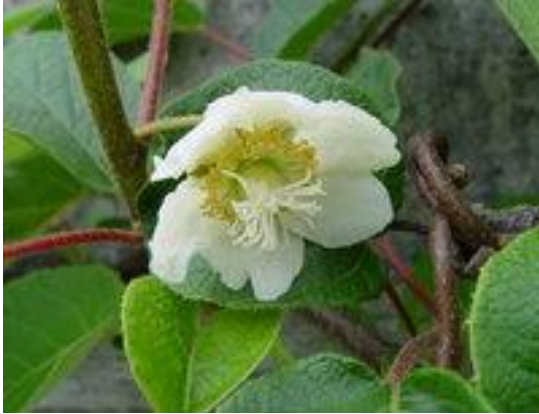
Actinidia chinensis (fiore)