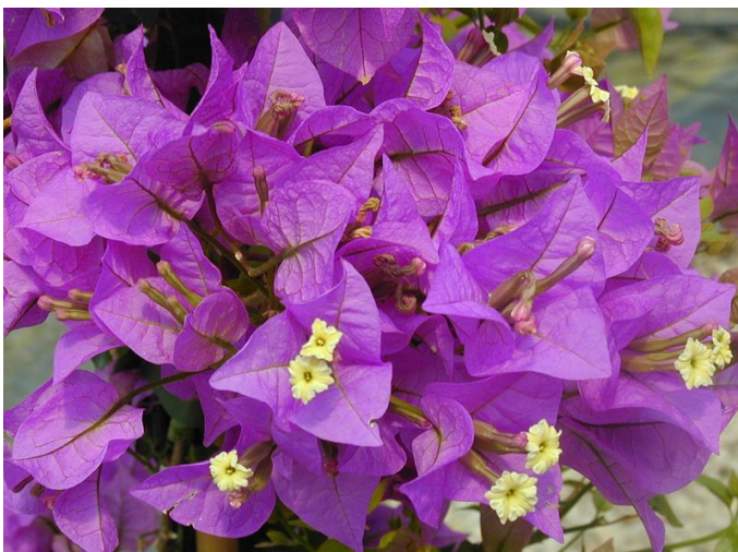
Bougainvillea glabra 'Sanderiana' (infiorescenze di fiori e brattee)