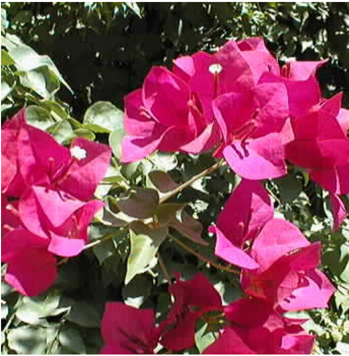
Bougainvillea x buttiana 'Mrs. Butt'

brattee da arancio-bronzo a rosso-ciliegia; 'Kiltie Campbell', con brattee arancioni che diventano scure con l'età.