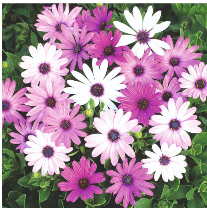
Dimorphotheca ecklonis (mix di varietà)

Da questa specie annuale, e dalla specie perenne D. aurantiaca , sono derivati diversi ibridi interessanti particolarmente per la fioritura primaverile delle aiuole. Salvo qualche eccezione, i capolini hanno la caratteristica di chiudersi in assenza di sole. Le specie perenni si coltivano generalmente come annuali.