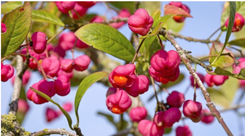
Euonymus europaeus (Fusaggine, Berretta da prete) frutti e semi

aprile e cimare, se necessario, da metà agosto a metà settembre.