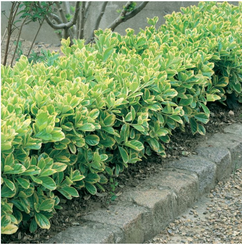
Euonimus japonicus 'Aureo-variegatus' a siepe