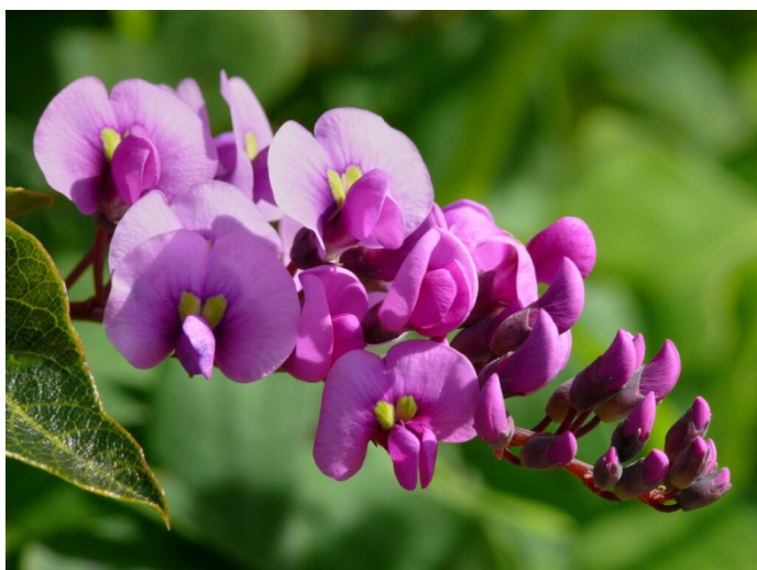
Macchie giallo-verdastre sulla corolla dei fiori

Pianta sempreverde, rampicante-volubile, da fiore e dalla crescita veloce. Foglie intere, lanceolate e allungate. I rami possono attorcigliarsi su altre piante vicine o su appositi supporti. Coltivabile all'aperto in località ove non siano da temere i geli.